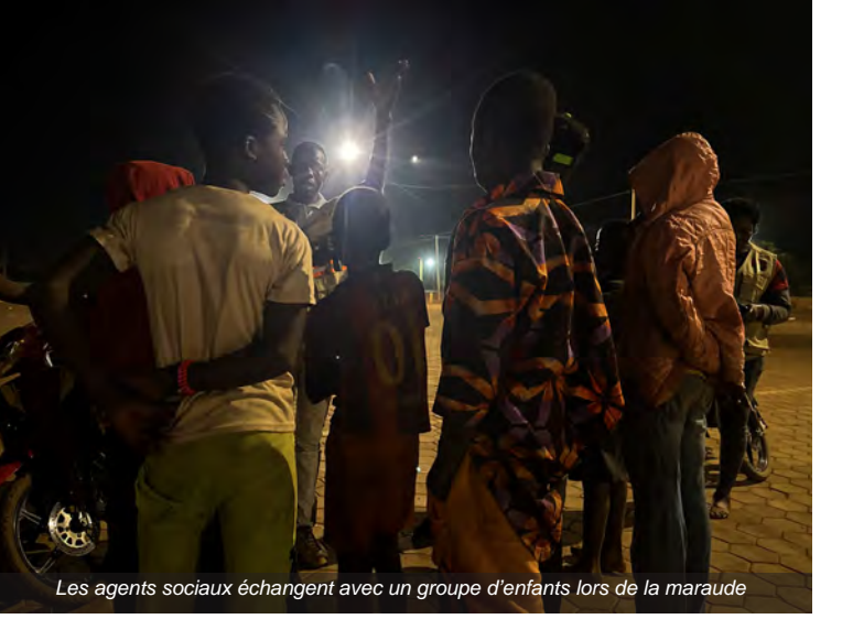
Les agents sociaux échangent avec un groupe d'enfants lors de la maraude

Quelques minutes plus tard, un groupe de dix enfants