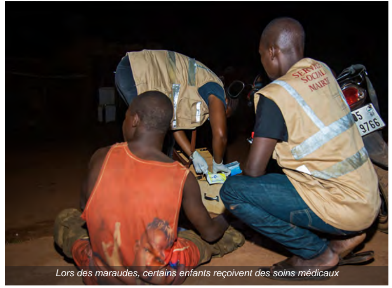
Lors des maraudes, certains enfants reçoivent des soins médicaux

Cette situation inquiète les services sociaux de la mairie de Koudougou qui, avec le soutien technique de Le Soleil dans La Main, ont créé l'équipe mobile d'aide communale pour la Protection de l'Enfant. Ils organisent aussi des formations de sensibilisation auprès des forces de l'ordre afin de créer