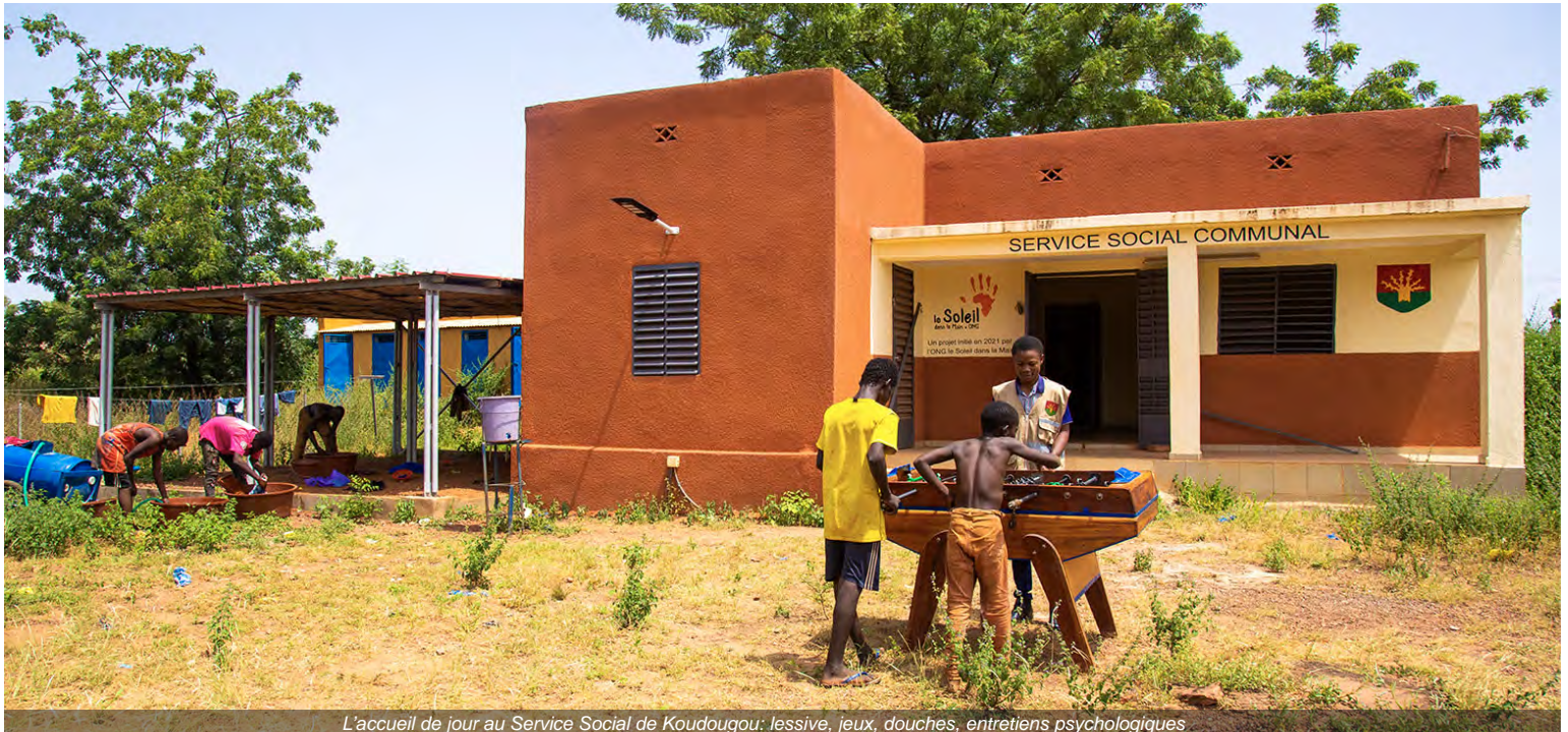
L'accueil de jour au Service Social de Koudougou: lessive, jeux, douches, entretiens psychologiques