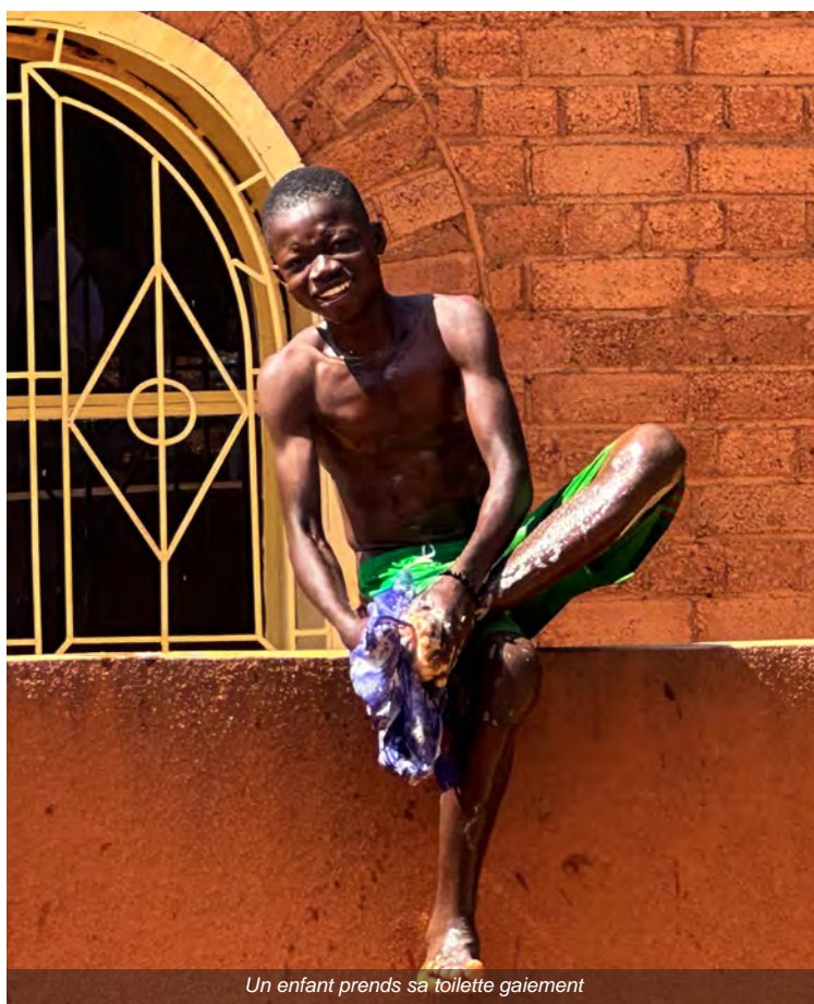
Un enfant prends sa toilette gaiement

“Les enfants des rues ne peuvent pas être intégrés directement à Noomdo, car ils risquent d'influencer rapidement les autres, de changer les règles”, explique Napon. Ce sont des enfants qui ont vécu un cauchemar dans la rue et qui savent se débrouiller dans toutes les situations, mais ils n'ont pas appris à respecter les normes”, explique Napon.