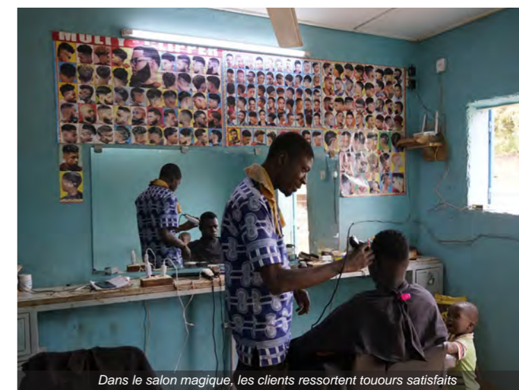
Dans le salon magique, les clients ressortent toujours satisfaits