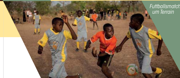
Futtbalsmatch um Terrain