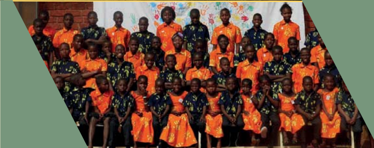
D'Kanner aus dem Heem NOOMDO

Mir hoffen, datt alles, wat d'Kanner während hirem Openthalt am Centre Noomdo léieren, hinnen d'Méiglechkeet gött, hiren eegene Liewensprojet opzebauen.