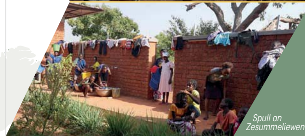
Spull an Zesummeliewen