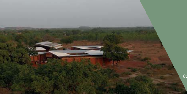
centre pour enfants à Koudougou