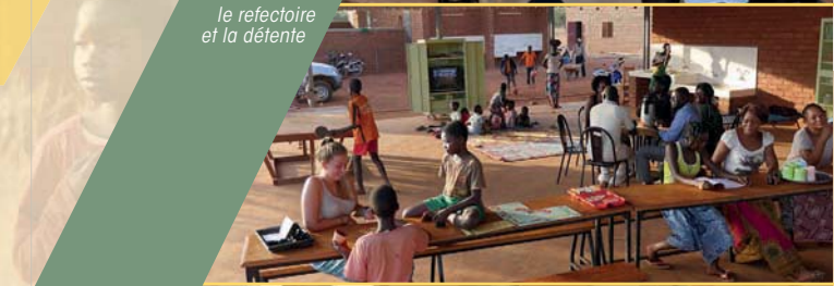
le refectoire et la détente