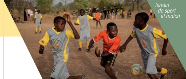
terrain de sport et match