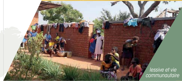
lessive et vie communautaire