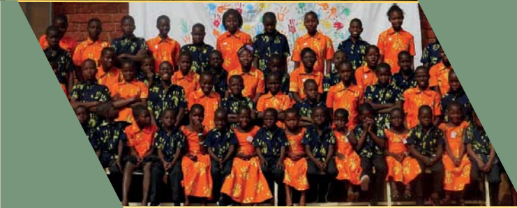
les enfants bénéficiaires