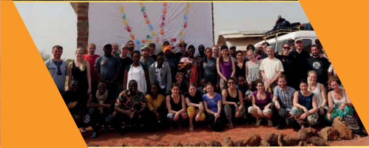
Austausch: Visite vun de Benevollen aus Lëtzebuerg