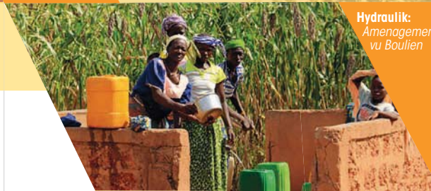
Hydraulik: Amenagement vu Boulieu

Am Burkina ginn et 60 verschidden Ethnien, déi méi wéi 60 verschidde Sprooche schwätzen. Verschidde Reliounen a Kulte cohabitieren: D'moslemesch Majoritéit leeft niewent Leit vu kathouleschem, protestanteschen an animisteschem Glawen. Dat harmonescht Vollek muss a sengem Fridden ënnerstëtzt ginn.