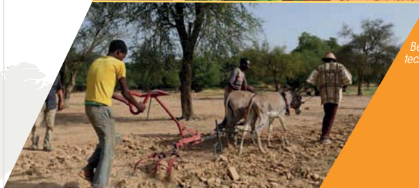
Landwirtschaft: Verbesserung vun de Bewirtschaftungs- techniken