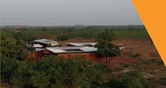
sozial: Kannerheem zu Koudougou